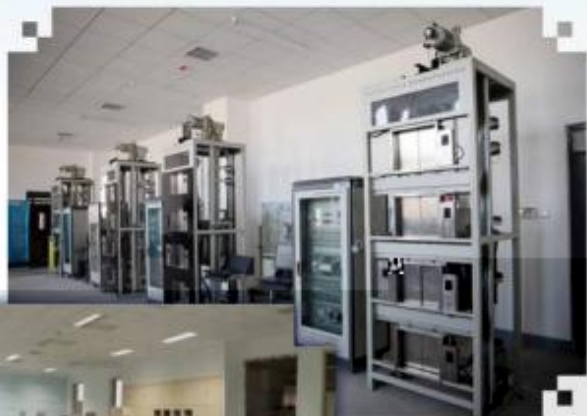
智能电梯安装调试 维护训练场所