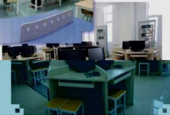
一体化课程教学设计 综合实训室