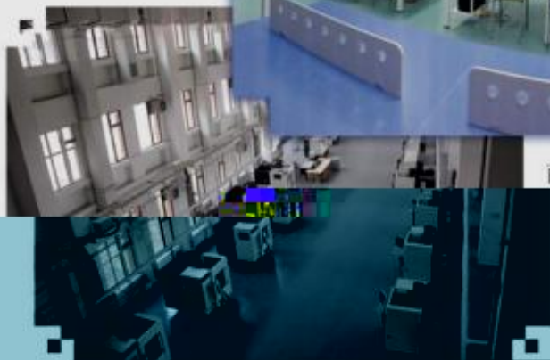
DMG 数控技术 训练场所