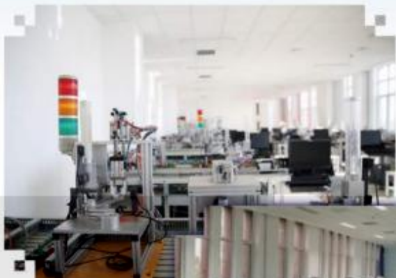
自动化生产线安装与 调试训练场所